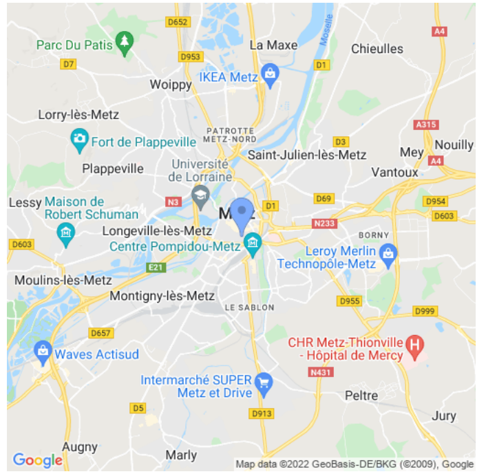
Carte : zoom 2