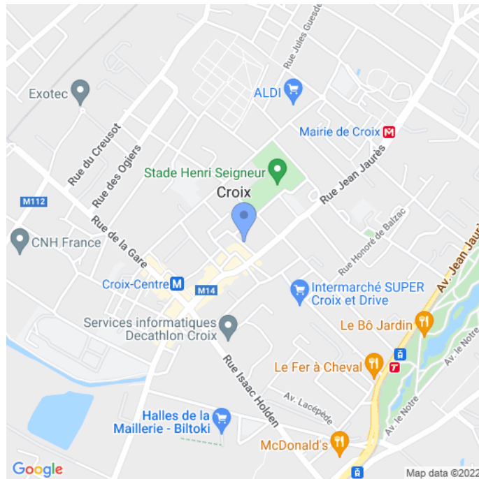
Carte : zoom 3

Facebook de l'événement : https://www.facebook.com/ledomainedesdiamantsblancs/