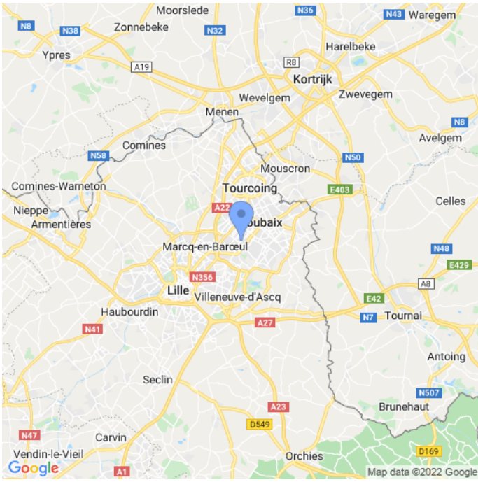
Carte : zoom 1