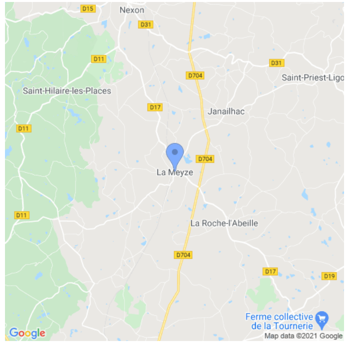
Carte : zoom 2