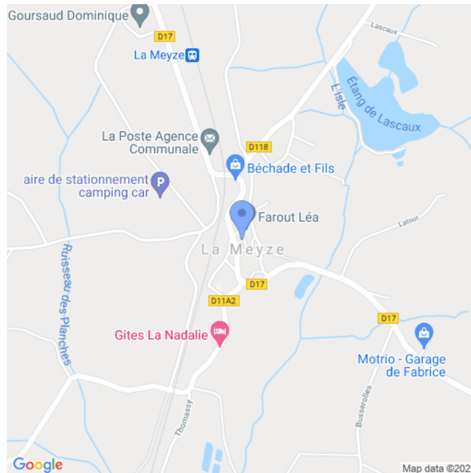
Carte : zoom 3

Facebook de l'événement : https://www.facebook.com/agvlameyze/