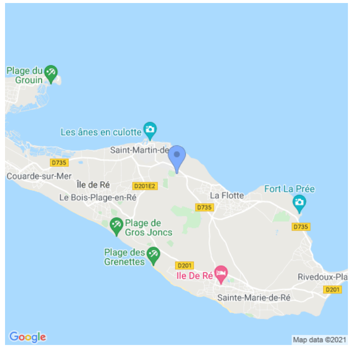
Carte : zoom 2