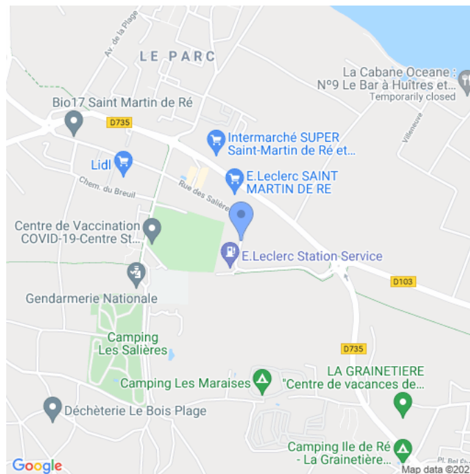
Carte : zoom 3

Site de l'événement : http://www.arssa.fr