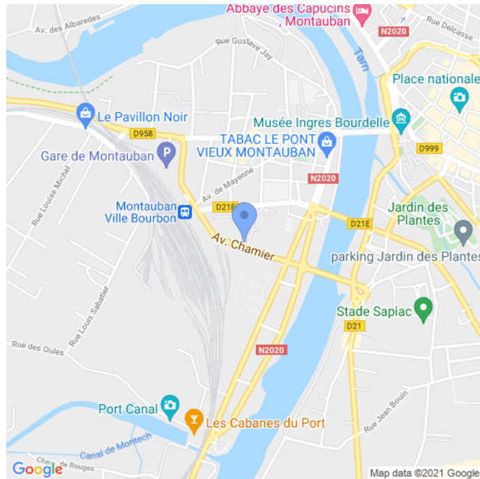
Carte : zoom 3

Site de l'événement : http://www.respirmouv.fr