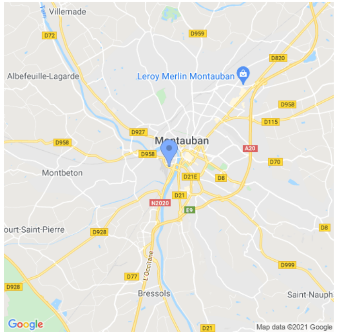
Carte : zoom 2