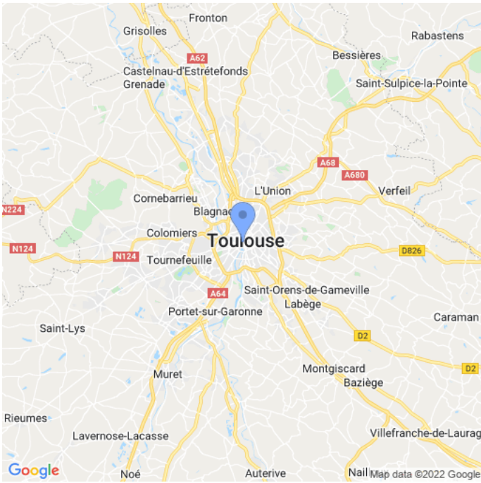
Carte : zoom 1