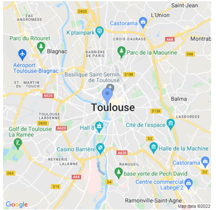
Carte : zoom 2