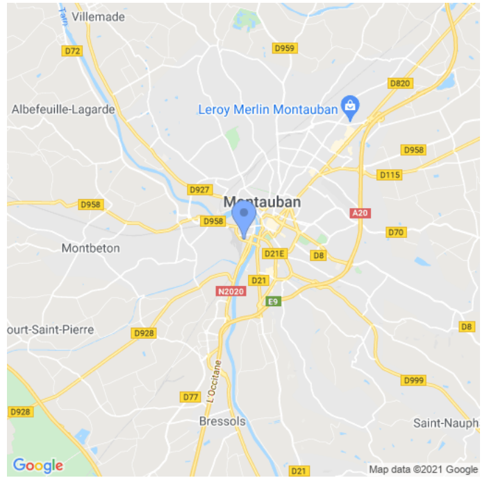
Carte : zoom 2