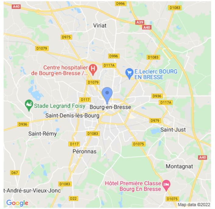
Carte : zoom 2