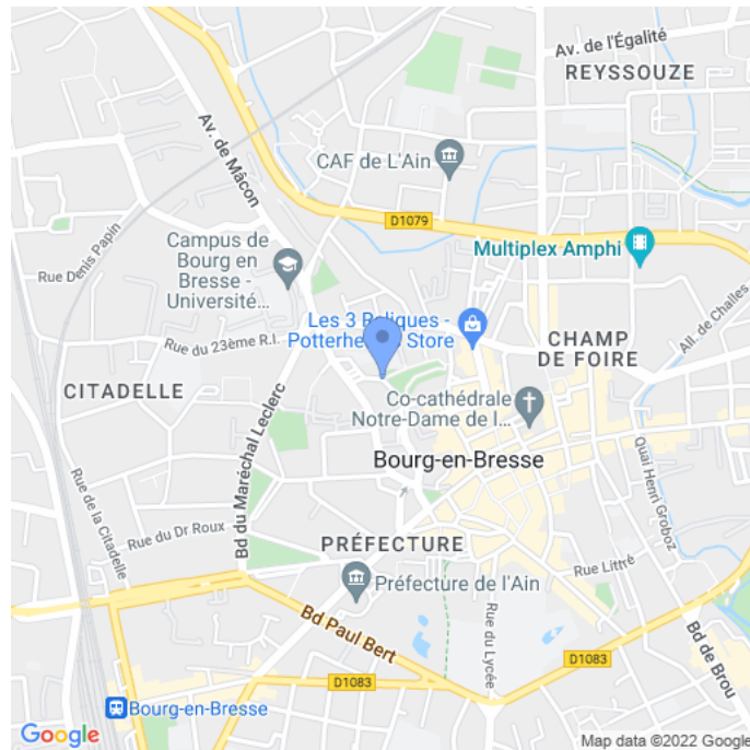
Carte : zoom 3