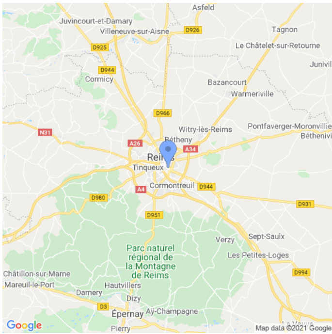
Carte : zoom 1