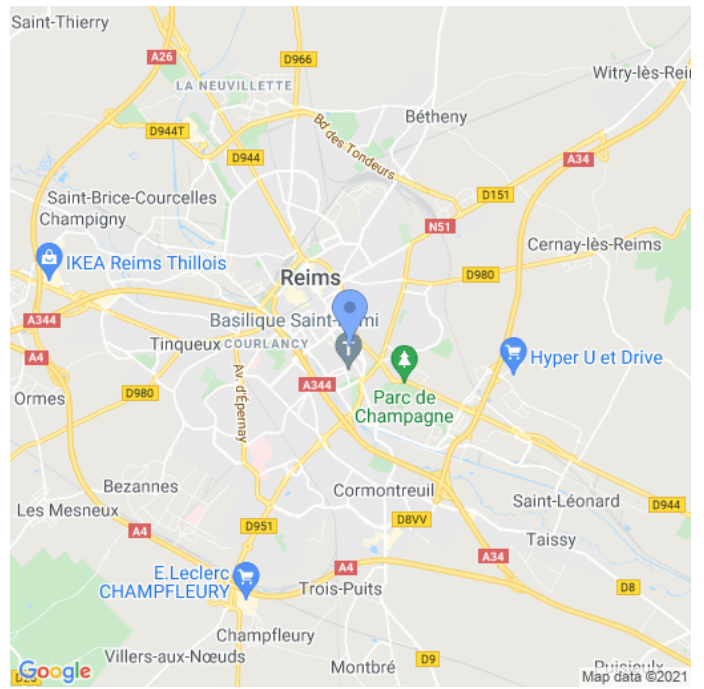
Carte : zoom 2